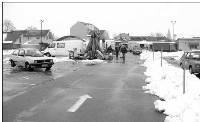
Protekla zima, jaki mrazevi i sneg svima su dojadili. I prodavcima i kupcima dosta je bilo zime. Nadamo se da gornja slika sada već pripada prošlosti.