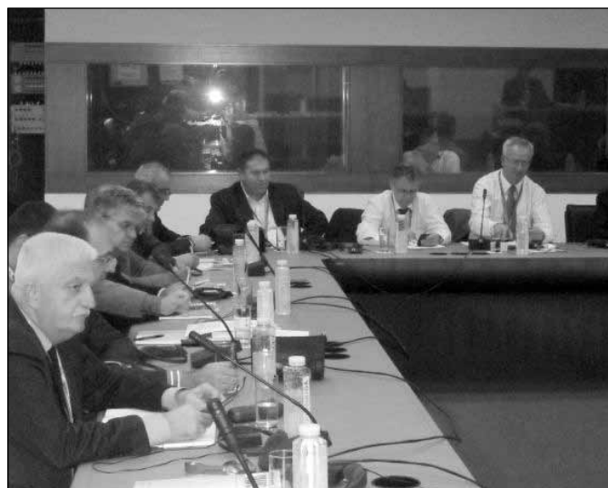
Predstavnici pijačnih uprava zemalja Zapadnog Balkana u Beogradu

Pored toga JKP „Subotičke pijace” aktivno učestvuje u radu, koji organizuje Stalna radna grupa za regionalni i ruralni razvoj za Jugoistočnu Evropu. Cilj ovih aktivnosti je unapređenje konkurentnosti preduzeća i organizacija iz jugoistočne Evrope u poljoprivrednom i prehrambenom sektoru, kroz implementaciju standarda kvaliteta hrane i regionalno povezivanje. Pijačne uprave iz regije - nakon nedavno održanog skupa u Beogradu - 28. i 29. marta sreće se u Sarajevu (Bosna i Hercegovina), kako bi razgovarali o formalizaciji regionalne saradnje između veletržnica i tržnica zemalja Zapadnog Balkana, o primeni standarda o bezbednosti hrane, kao i dobroj praksi u prometu poljoprivrednih i prehrambenih proizvoda. Učesnici sastanka će posetiti JKKP „Tržnice-pijace” Sarajevo i obići neke pijace u Sarajevu.