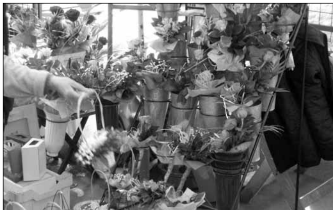
Pijace su bile pune cveća...

Ove godine nije organizovan vašar cveća na Trgu Slobode u organizaciji JKP „Subotičke pijace”, ali Subotičanke ni ovom prilikom nisu ostale bez cveća, pošto je na pijacama bila veoma dobra ponuda i rezanog i saksijuskog cveća.