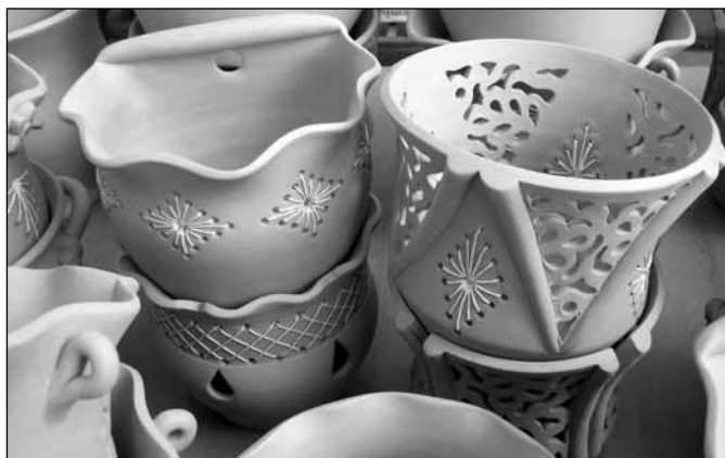
...ali smo mogli kupiti i druge poklone.

Smanjena kupovna moć se osećala i na ceni cveća, pošto su prodavci ovom prilikom bili prinuđeni, da se zadovolje nižom maržom. Tome je doprinela i uobičajena slika, da su se u raznim delovima grada (i centra) pojavili ilegalni prodavci cveća, koji naravno nisu plaćali naknadu za korišćenje javne površine, niti druge dažbine, pa su svoju robu mogli nuditi po nižim cenama od onih na pijacama (naravno ti prodavci nisu ni najmanje blagonaklono gledali na one, koji su ih pokušavali slikati).