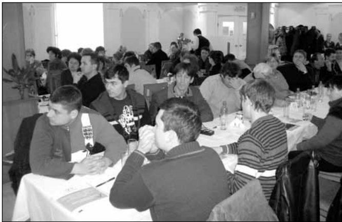
Učesnici konferencije u Nepkeru

Bez obzira na ugovor koji su potpisali Subotica kao vodeći partner i Segedin kao projektni partner, oni koji su radili na realizaciji konkretnih poslova, još nisu dobili finansijsku podršku iz ugovora. To zato naglašavam, jer nam je pre početka realizacije projekta bilo jasno, da će izvršavanje obaveza iziskivati angažovanje značajnih intelektualnih potencijala, uz istovremeno uključivanje velikog broja učesnika ukoliko želimo uspešno realizovati projekat, međutim priprema i realizacija raznih priredbi već iziskuje konkretna finansijska ulaganja, a za te namene nismo dobili ni jedan cent. U našem slučaju to je trebao da nam obezbedi Grad Subotica, ali još uvek čekamo novac, a u ovakvim uslovima – imajući u vidu opštu ekonomsku situaciju – lako se mogu shvatiti oni problemi, koji proizilaze iz nedostatka obećane i ugovorom garantovane finansijske podrške. Naravno mi sa naše strane nećemo dozvoliti, da se realizacija projekta stavi pod znak pitanja sada, kada polako stižemo do završne faze, ali bilo bi dobro, da nem se prenese barem deo uloženi sredstava. U toku pripreme projekta bilo nam je jasno, da su pravila u vezi EU projekata veoma stroga u pogledu realizacije i obračuna, znali smo da do zadnjeg centa moramo opravdati sav potrošeni novac, znali smo da se projekat naknadno finansira, ali to nismo mogli pretpostaviti, da ugovoreni avans nećemo dobiti ni dobiti naknadno.