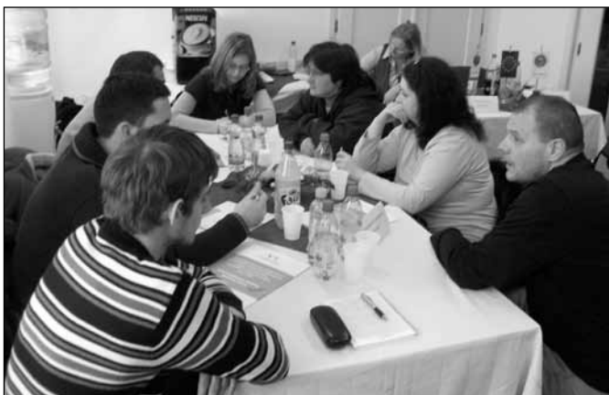
Susret proizvođača i privrednika

Bez obzira na ugovor koji su potpisali Subotica kao vodeći partner i Segedin kao projektni partner, oni koji su radili na realizaciji konkretnih poslova, još nisu dobili finansijsku podršku iz ugovora. To zato naglašavam, jer nam je pre početka realizacije projekta bilo jasno, da će izvršavanje obaveza iziskivati angažovanje značajnih intelektualnih potencijala, uz istovremeno uključivanje velikog broja učesnika ukoliko želimo uspešno realizovati projekat, međutim priprema i realizacija raznih priredbi već iziskuje konkretna finansijska ulaganja, a za te namene nismo dobili ni jedan cent. U našem slučaju to je trebao da nam obezbedi Grad Subotica, ali još uvek čekamo novac, a u ovakvim uslovima – imajući u vidu opštu ekonomsku situaciju – lako se mogu shvatiti oni problemi, koji proizilaze iz nedostatka obećane i ugovorom garantovane finansijske podrške. Naravno mi sa naše strane nećemo dozvoliti, da se realizacija projekta stavi pod znak pitanja sada, kada polako stižemo do završne faze, ali bilo bi dobro, da nem se prenese barem deo uloženi sredstava. U toku pripreme projekta bilo nam je jasno, da su pravila u vezi EU projekata veoma stroga u pogledu realizacije i obračuna, znali smo da do zadnjeg centa moramo opravdati sav potrošeni novac, znali smo da se projekat naknadno finansira, ali to nismo mogli pretpostaviti, da ugovoreni avans nećemo dobiti ni dobiti naknadno.