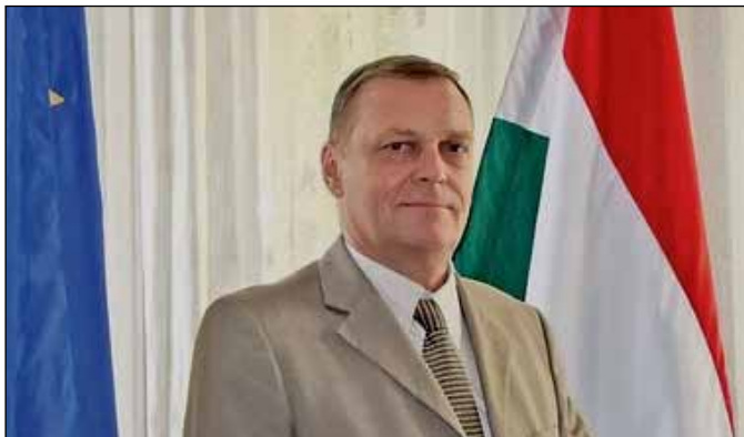
Tamaš Koršoš, generalni konzul Mađarske u Subotici

Mađarska već godinama podržava učešće preduzeća iz Mađarske na različitim sajmovima u inostranstvu, tako i u Srbiji. Činila je i čini to i u slučaju sajma u Subotici. U kojoj meri sve to doprinosi razvoju privrednih odnosa i prometa roba i usluga između Mađarske i Srbije – pitamo Tamaša Koršoša, generalnog konzula Mađarske u Subotici.