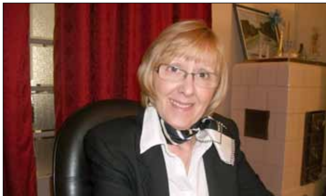
Vesna Njikoš Pečkaj, konzul savetnik Hrvatske u Subotici

Na VI Međunarodnom i regionalnom sajmu privrede preduzeća iz Republike Hrvatske nastupiće i ove godine u zapaženom broju. O tome za Informator govori Vesna Njikoš Pečkaj, konzul savetnik Generalnog konzulata Republike Hrvatske u Subotici: