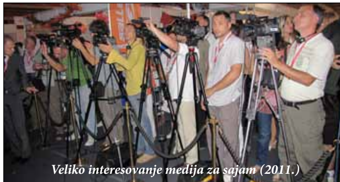
Veliko interesovanje medija za sajam (2011.)

- O sajmu treba još znati, da je svečano otvaranje 6. juna u 11.00 časova, i da izuzev prvog dana sajam je otvoren od 10.00 do 19.00 časova, a nadamo se da među posetiocima biće puno i građana, kao i učenika odnosno studenata.