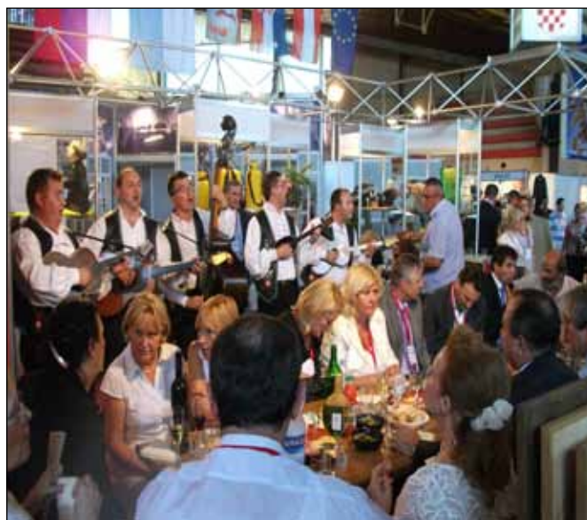
Gosti otvaranja na štandu Hrvatske (2011.)

- Postoji interes Hrvatske i za ulaganja u ovdašnju privredu, a to će omogućiti i intenzivnije zapošljavanje pripadnika hrvatske manjinske zajednice, a istovremeno zahvaljujući sporazumima Srbije o slobodnoj trgovini sa Rusijom, Belorusijom i Turskom pruža se mogućnost i za konkretne poslove u oblasti prometa roba odnosno usluga. Ta saradnja između dve privrede, preduzeća iz Hrvatske i Srbije već postoji, a sajam u Subotici svakako doprinosi jačanju te saradnje. Upravo zbog toga pokušavamo iz godine u godinu obezbediti prisustvo novih izlagača na sajmu u Subotici, kako bi mogli steći što širi uvid u mogućnosti naše privrede, odnosno, kako bi smo obezbedili neposredne kontakte naših privrednika sa privrednicima iz Srbije, da se što bolje međusobno upoznaju, razmene informacije i da ta saznanja što je moguće bolje iskoriste za razvoj kako privredne, tako i bilateralne saradnje naših zemalja.