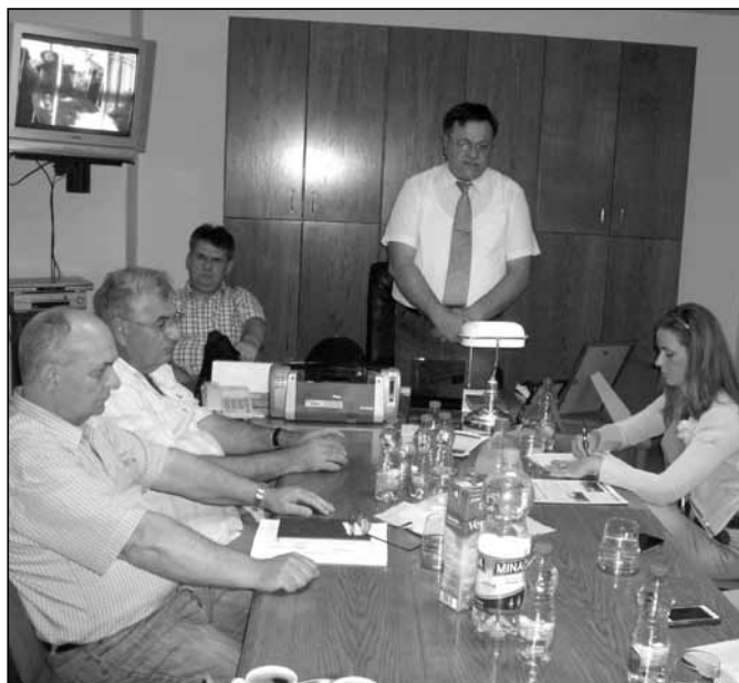
Direktor Bela Bodrogi govori gostima o radu JKP

Cilj ovih razgovora i posete delegacije iz Makedonije je bio unapređenje i jačanje regionalne saradnje pijaca Zapadnog Balkana, kao i stvaranje uslova za međusobnu razmenu informacija odnosno iskustava.