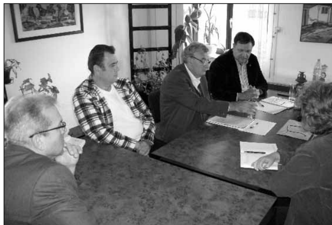
Učesnici razgovora u Bačkoj Topoli

Takođe je obezbeđena finansijska podrška raznim, prvenstveno seoskim manifestacijama, kao što su bili trka magaraca u Bačkim Vinogradima, berbanski dani na Paliću, Hajdukovu i Kelebiji, festivalu belog luka i proslavi dana sela na Šupljaku, zatim humanitarnoj akciji „Plodovi humanosti“ Rotary kluba, itd.