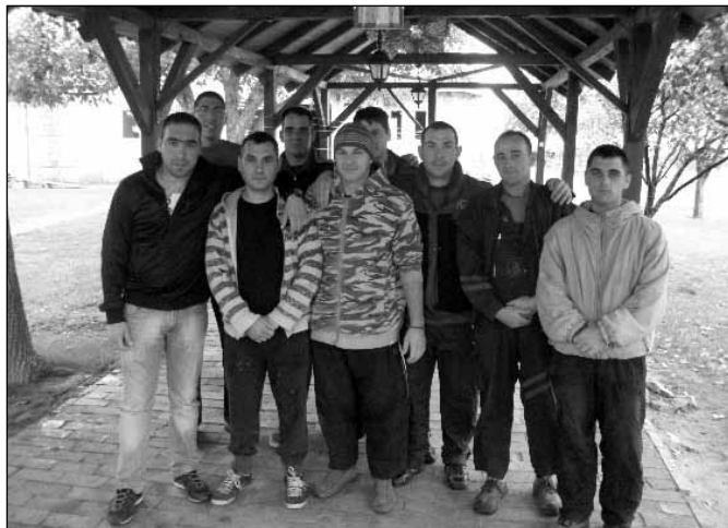
Voditelj i štićenici

Zajednica je registrovana kao udruženje građana, ali nema svoje stalne izvore prihoda, pošto se izdržava isključivo iz podrške i donacija. U leto je proslavila 5. godišnjicu svog postojanja. Članovi zajednice mogu biti mladi muškarci, a slična zajednica za devojke i žene radi u drugom mestu. U okviru programa pokušavamo u ljudima probuditi njihove prave vrednosti. Svakom štićeniku pružamo pomoć, da upozna sebe, svoje mane, vrline i talente, da u njima jačamo svest, da uz velika odricanja ali mogu se zaustaviti na nizbrdici i da ima povratka za njih. U drugoj godini naši štićenici se pripremaju da se mogu snaći i izvan zajednice bez da njihove slabosti ponovo dovode u opasnost njih same i njihovo okruženje. U trećoj godini se nastavlja jačanje njihove ličnosti, ali se naglasak daje na sposobnost da i oni pomognu drugima. A možda je ovo i najvažnije, jer svakog ovisnika karakteriše egoizam i sebičnost. Ako budu uspeli savladati ovu sebičnost, ako budu znali nesebično pomagati drugima, tek onda mogu početi razmišljati o životu izvan zajednice. Zajednica istovremeno može da primi 15 mladića, a za njeno funkcionisanje potrebno je isto, što i svakoj velikoj porodici: hrana, odeća, ogrev, građevinski materijal.