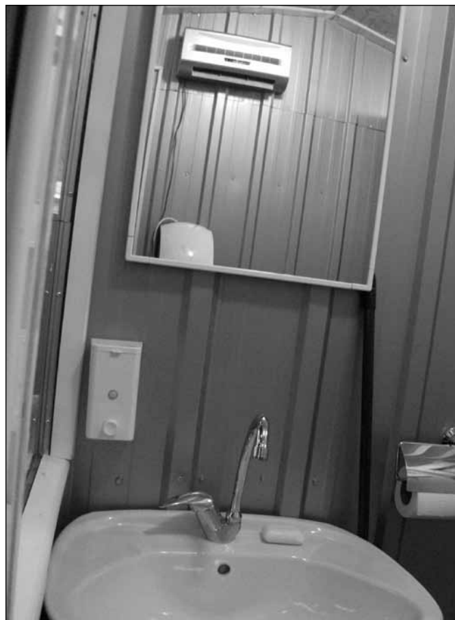
Savremeni toalet na Mlečnoj za „sanitarce“

- Na Mlečnoj pijaci i na Zelencu u toku je ugradnja termometara u rashladne vitrine, pomoću kojih će i prodavci a i organi inspekcije moći veoma jednostavno proveriti funkcionisanje rashladnih uređaja. Ovaj posao će malo potrajati, pošto ih možemo obaviti nakon zatvaranja pijaca odnosno kada su rashladne vitrine prazne, pošto sama ugradnja ne zahteva veće zahvate, ali ipak majstori moraju sačekati da se rashladne vitrine isprazne.