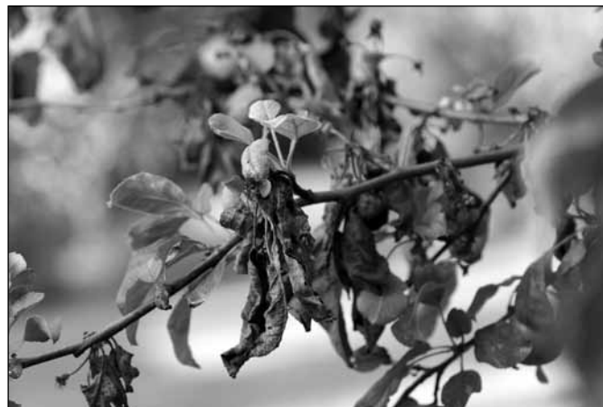
Simptomi Erwinia amylovora

Tokom zimske rezidbe uklanjaju se sve grane sa suvim lišćem i plodovima i grane na kojima su prisutne rak rane koje imaju najveći značaj kao izvor infekcije. Pri uklanjanju obolelih grana voditi računa da rez bude udaljen 30 cm od mesta nekroze ako sečemo grane debljine do 25 mm. Ako sečemo deblje grane rez se pravi na udaljenosti od najmanje 60 cm. Ukoliko ovo rastojanje vodi do debla potrebno je izvaditi celo stablo.