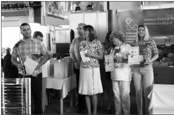
Sa dodele sajamskih nagrada