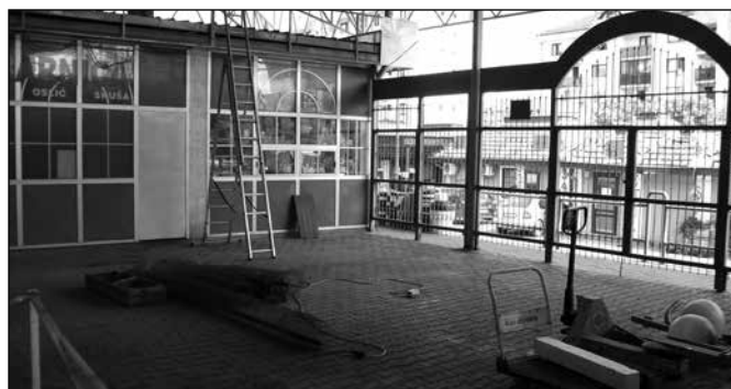
i posle razmeštanja tezgi